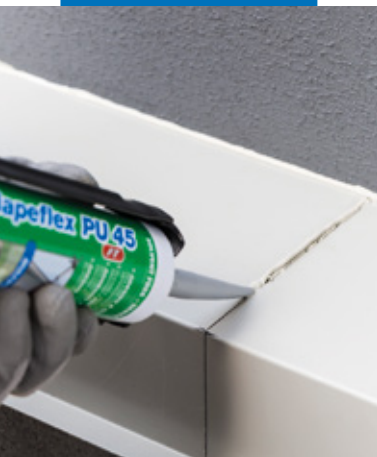
Sigillatura elastica di giunti di costruzione

utilizzabile sia su superfici orizzontali che verticali.