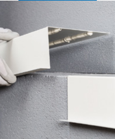
Incollaggio elastico di elementi costruttivi